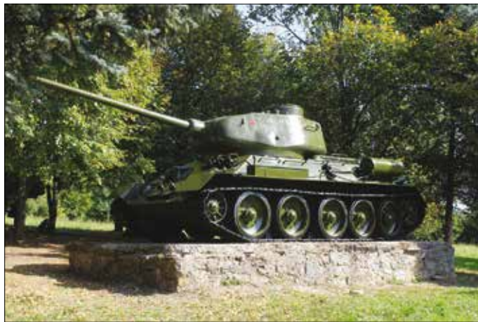
Pamätník bojov v obci Dargov.