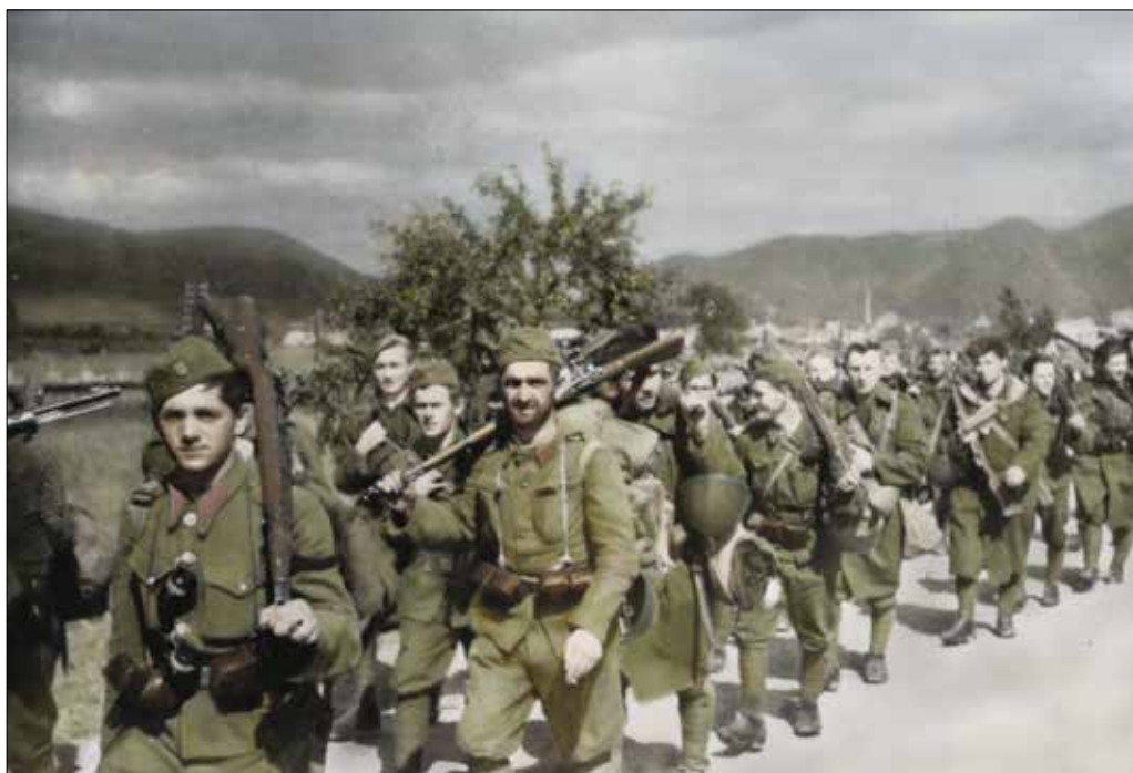
Presun povstaleckých jednotiek počas SNP