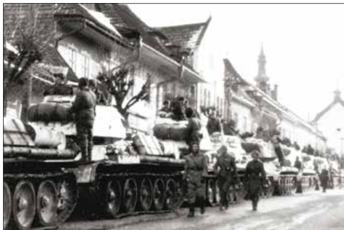
Československé jednotky v oslobodenom Liptovskom Mikuláši