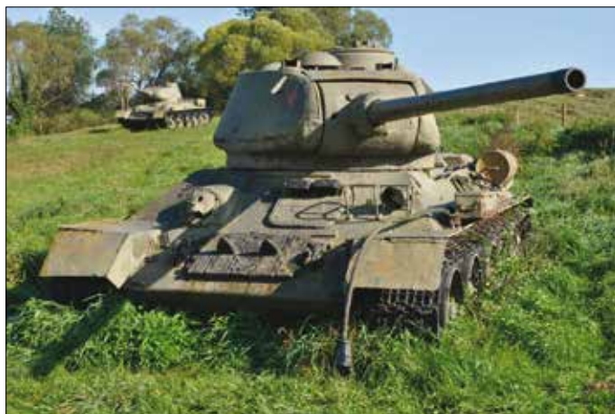
Stredný tank T34-85 v Údolí smrti