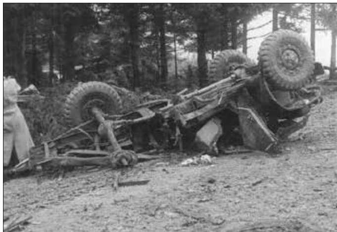
Automobil generála Vedrala-Sázavského zničený mínou