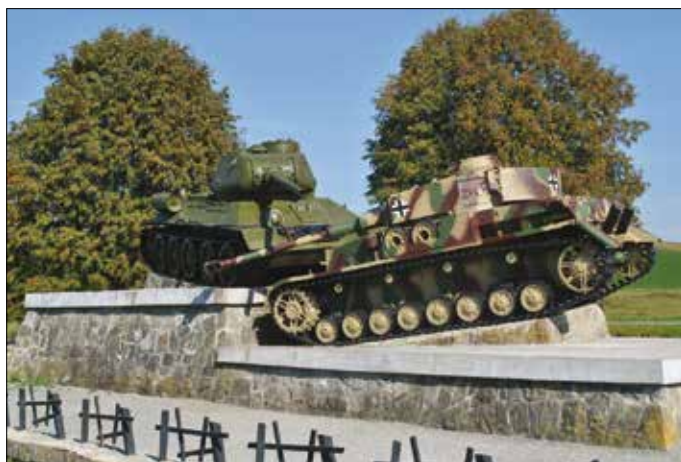
Symbolika TARAN - tank T-34-85 vkladný do nemeckého tanku PzKpfw IV. Ausf. J na rázcestí do Údolia smrti