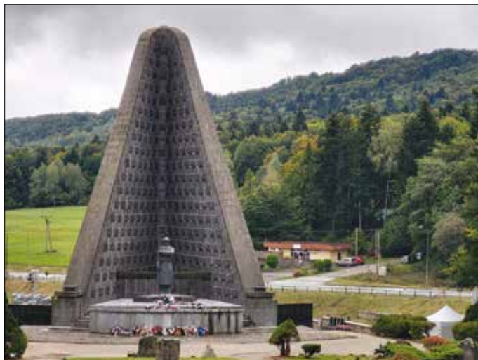
Pamätník čs. armádneho zboru na Dukle s vojnovým cintorínom