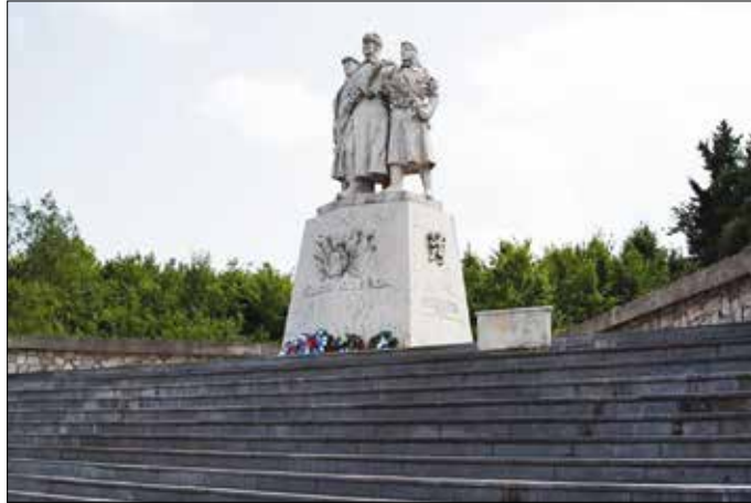
Pamätník bojov v Dargovskom priesmyku