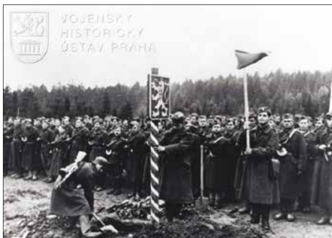
Vztýčenie hraničného stĺpu na československo-poľskej hranici príslušníkmi 1. československého armádneho zboru