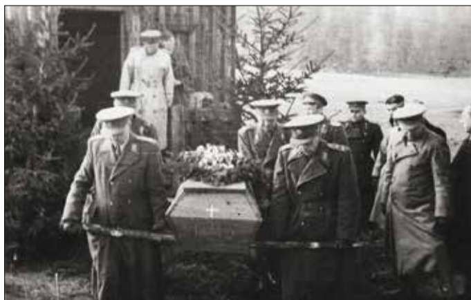
Pohreb generála Vedrala-Sázavského. Rakvu nesú v prednom rade generáli Svoboda a Klapálek, za nimi generál Hasal