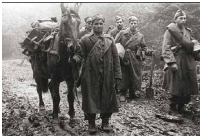
Československé jednotky počas postupu Duklianskym priesmykom