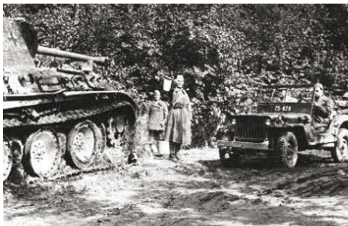
Československé jednotky počas postupu na Duklu v blízkosti hraníc ČSR