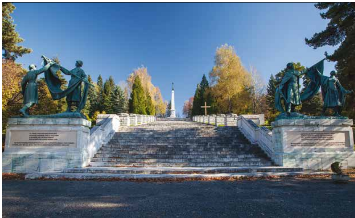
Pamätník Háj - Nicovô v Liptovskom Mikuláši.